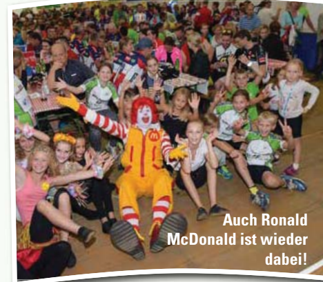
Auch Ronald McDonald ist wieder dabei!