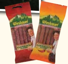
Wiesbauer TYPISCH ÖSTERREICHISCH Kaminwurz'n Klassik & Scharf