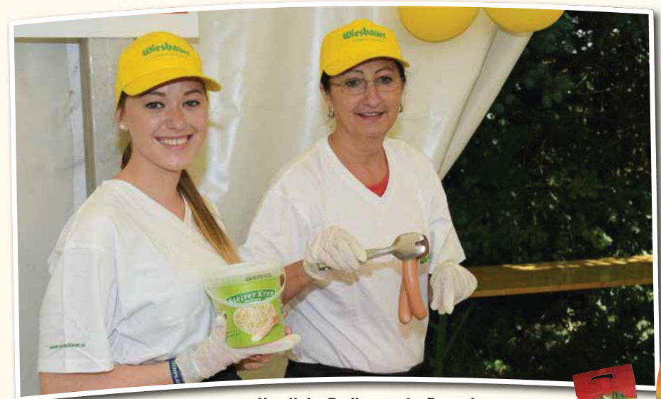
Herzliche Bedienung im Festzelt